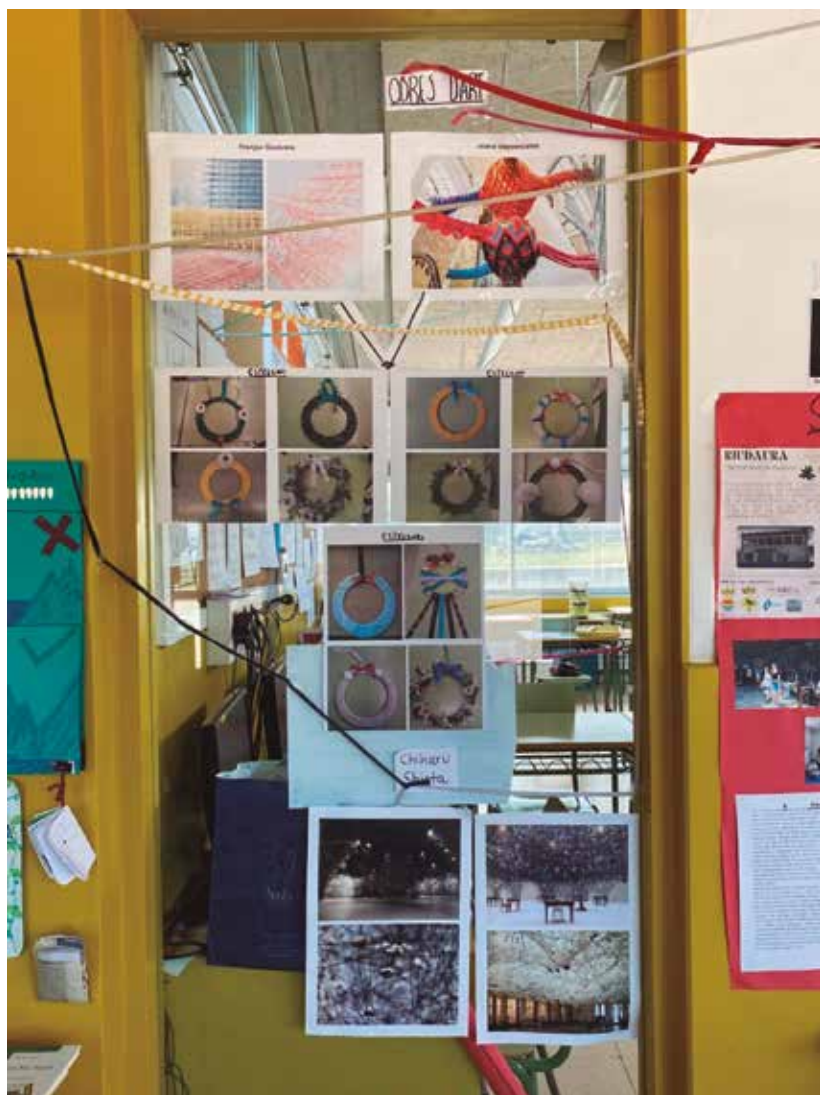
Fils i aprenentatges a l'escola Lluís Castells de Riudaura.

de l'educació un espai de llibertat i del bè comú. Una pedagogia compromesa, descolonial amb el poder establert i amb les narratives legitimades, i amb una visió planetària i sostenible, de forma que aprenguem per ensenyar a transgredir i transformar. bell ens regala un capítol que titula «Saviesa pràctica» en