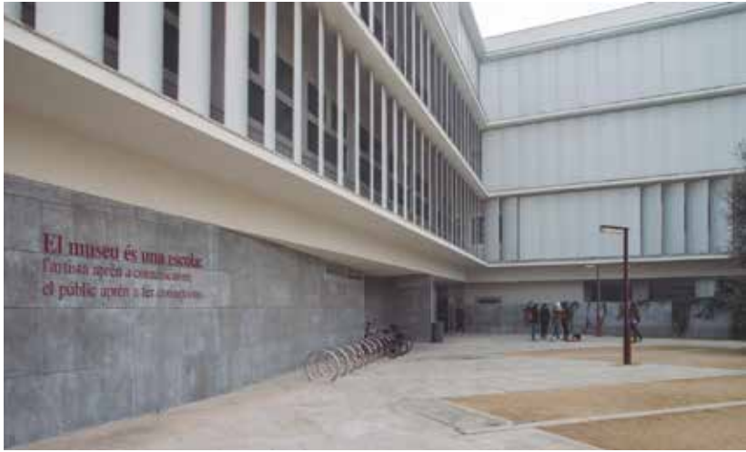
Obra intervinguda en la Façana de la Facultat d'Educació, Psicologia i Treball social de la Universitat de Lleida. Fotògraf: Xavier Goñi.

natural és o hauria d'esdevenir una escola, una biblioteca és o hauria d'esdevenir una escola... Aprenem més enllà de les aules amb el patrimoni i el territori i amb l'art i les pràctiques artístiques contemporànies (Jové, 2017) com a mitjà d'expansió del coneixement i de comprensió de la nostra realitat humana. Fer-ho ens permet obrir mirades i fer connexions per donar resposta a l'heterogeneïtat, la complexitat i la incertesa que caracteritzen els contextos del segle XXI. Diversitat, diferència, heterogeneïtat, alteritat, etiquetes, creences, expectatives, estratègies metodològiques i organitzatives són termes, són conceptes, són vivències, són experiències que formen part de la vida en el nostre context de formació. Creure que la diversitat és un fet, viure-la, sentir-la i gaudir-la ens condueix al desig de descobrir l'altre, de saber de la seva existència, perquè la seva existència és la que forma el meu ésser. Desig d'alteritat és el títol del llibre publicat el 2006 juntament amb l'escola Príncep de Viana i que va rebre el premi Batec a la innovació educativa el 2005, on mostrem com aprenem amb el projecte «Àlber».