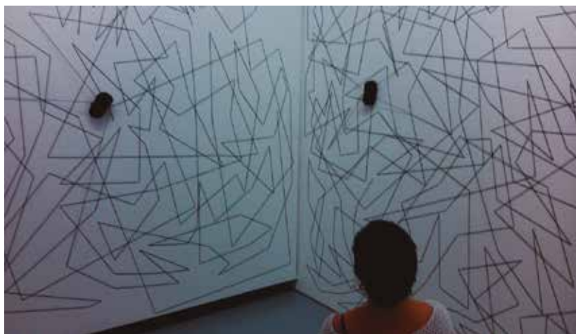
Inici de la instal·lació In the beginning was , de Chiharu Shiota, a la Fundació Sorigué.

Continuem estirant el fil i ens trobem amb molts altres artistes que els utilitzen en la seva obra, perquè entenen el fet de teixir com un procés de construcció que crea comunitat. Sonia Gomes, artista del Brasil, teixeix la seva obra a través de la costura, unió de teles, papers, fils, cartró, brodats, filferro, puntes que té al seu abast i que no tenen un ús actual, creant, així, una nova narrativa. El 2015 vaig tenir un encontre amb l'obra de Chiharu Shiota a la fundació Sorigué. Fins a trenta estudiants de la universitat vam participar en la creació de la instal·lació In the beginning was .